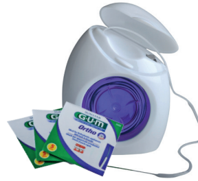
3220M GUM Ortho Floss - 933015238