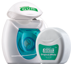
2040 GUM Original White floss - 904802749