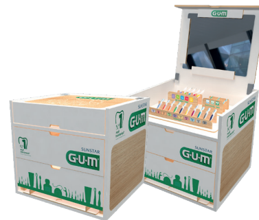
GUM SUPER BOX: Silver e Gold