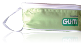
528KITPREST KIT PRESTIGE PREVENZIONE MALATTIE SISTEMICHE