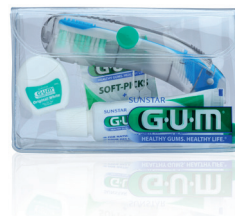
156 GUM Travel Kit - 902311606