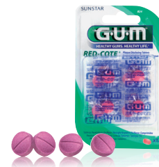
824 GUM Red-Cote® pastiglie rivela placca - 902224195