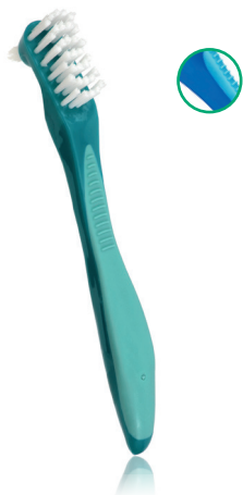
201 GUM Denture Brush per protesi - 902222850