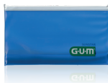
124KITECOB20 KIT ECO ORTODONTICO