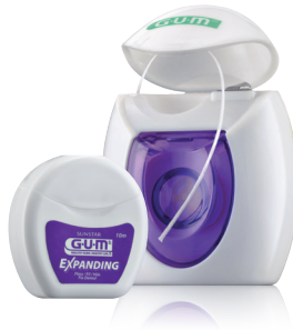
2030M GUM Expanding Floss - 900415100