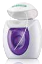
2030M GUM Expanding Floss 900415100