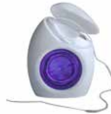
3220M GUM ORTHO Floss 933015238