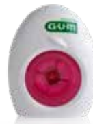
1155 GUM Butlerweave' cerato 906668076