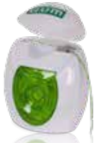
3500 GUM TWISTED FLOSS 984881019