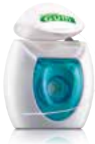
2040 GUM Original White 904802749