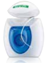
2000 GUM Easy-Floss 935689808