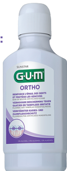
GUM ORTHO Bain de bouche 300 ml Sans alcool (Fluor 400 ppm)