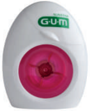
1155 Seda dental con cera (55 m) CN 370726.8