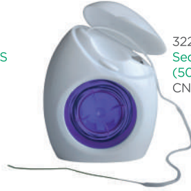
3220 Seda dental ORTHO (50 usos) CN 339587.8