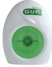
1855 Seda dental con cera mentolada (55 m) CN 228288.9