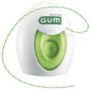
3500 Seda dental Twisted (30 m) CN 207619.8