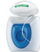
2000 Seda dental EASY (30 m) CN 359083.9