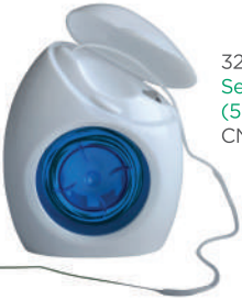
3200 Seda dental ACCESS (50 usos) CN 339588.5