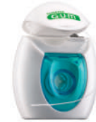
2040 Seda dental Original White (30 m) CN 237804.9