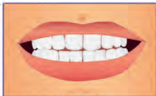
Wygląd zębów po zakończeniu leczenia przy dobrej higienie jamy ustnej