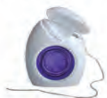
Nić GUM Ortho