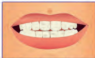
Wygląd zębów po zakończeniu leczenia przy złej higienie jamy ustnej

Wygląd i zdrowie zębów po zdjęciu aparatu i zakończeniu leczenia zależy od poziomu higieny utrzymywanego w trakcie procesu. Konieczne jest zatem kilka rutynowych wizyt higienizacyjnych każdego roku