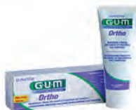
Pasta GUM Ortho