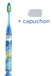
TIMER-LIGHT Brosse à dents 903