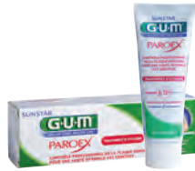
GUM PAROEX Gel dentifrice 1770